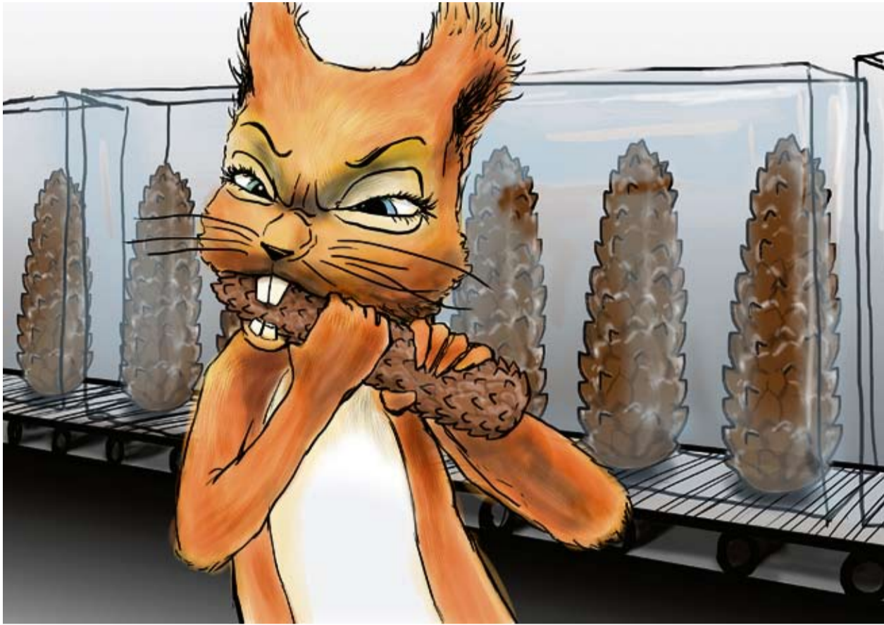
«Bäh!» Auch wenn sie noch so echt aussehen – mit diesen geschmacklosen Dekozapfen aus Kunststoff kann Lilly wenig anfangen.

«Sirupflasche, Telefon, Toilettenbrille», murme ich und schreibe es mit der quietschenden Kreide auf die kleine Schiefertafel. Lilly schaut mich zweifelnd an. «Was ist, Lilly?» – «Oh, Wasserhahn!» Die Kreide quietscht wieder über den Schiefer. «Was mit dir los ist, frage ich mich. Seit du heute von der Schule nach Hause gekommen bist, rennst du herum und schreibst Sachen auf. Und dann diese Geräusche von der Kreide ... Sogar ich bekomme da Hühnerhaut, und ich bin doch ein Eichhörnchen!» Ich muss grinsen. «Wir haben heute in der Schule ein neues Thema begonnen, und als Hausaufgabe müssen wir alles aufschreiben, was wir bis morgen benutzen, das aus Kunststoff ist. Und seit ich hier bin, habe ich mir einen Sirup gemacht, bin ans Telefon gegangen und war auf der Toilette – überall hatte es Kunststoff!» – «Hier auch?» Lilly klopft an die weisse Kappe des Wasserhahns. «Genau! Das, was wir im Alltag Plastik nennen, heisst eigentlich Kunststoff. Und da wir Kunststoff bis morgen möglichst wenig benutzen sollen, habe ich die Schiefertafel meiner kleinen Schwester ausgeliehen. Der Leim, der bei meinem Schreibblock die Blätter zusammenhält ...» – «... ist auch aus Kunststoff, schon klar!», ruft Lilly.