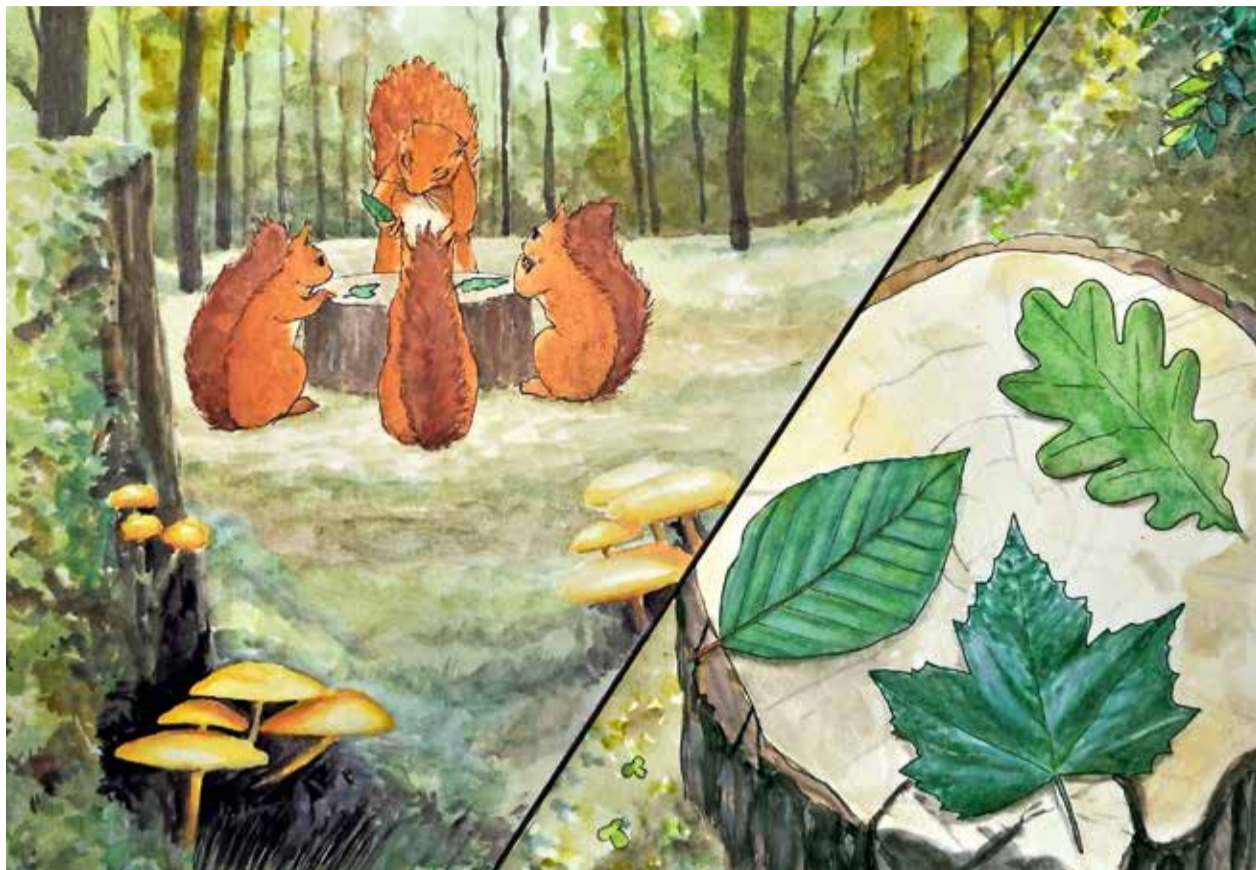
Lilly nimmt alle drei Blätter ganz genau unter die Lupe! Zu welchem Baum sie wohl gehören?

Anders ist es bei den meisten Nadelbäumen: Sie behalten ihre grünen Nadeln, auch wenn der Winter sehr kalt ist. Dies ist möglich, weil die Nadeln besser gegen kalte Temperaturen geschützt sind. Ihre kompakte Form und ihre feste Oberfläche schützen sie davor auszutrocknen, auch wenn das Wasser im Boden gefroren ist. Zudem sind die Nadeln von einer Art Wachs umgeben, welche sie zusätzlich schützt. So können wir uns jedes Jahr auf all die bunten Blätter, die wir sammeln und für viele Basteleien verwenden können, freuen. Die grünen Nadelbäume erfreuen uns an Weihnachten, festlich geschmückt, mit ihrem grünen Kleid.