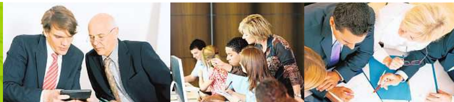
Design by Winterthurer Zeitung